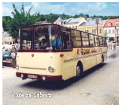
Růžka ze Sebnitz