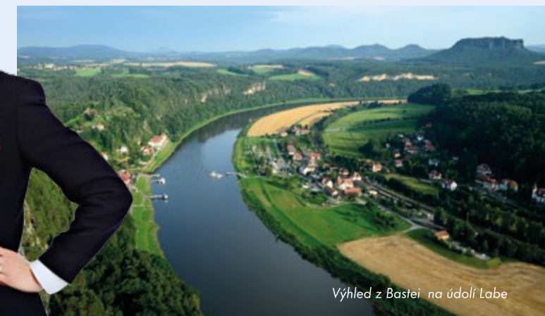
Výhled z Bastei na údolí Labe

sobota 10.00 – 18.00 neděle 10.00 – 18.00