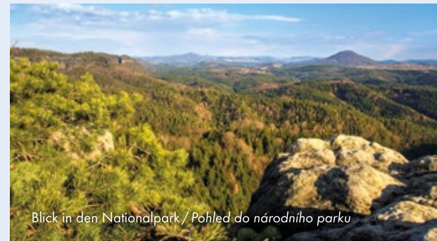
Blick in den Nationalpark / Pohled do národního parku

z Rumburku: vlaky linky U 28 z Krásné Lípy: vlaky linky U 27 / U 28